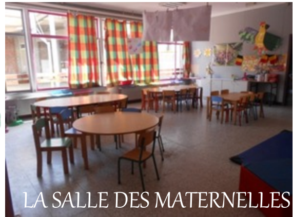
LA SALLE DES MATERNELLES