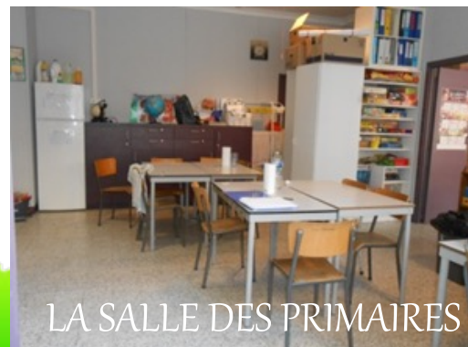
LA SALLE DES PRIMAIRES