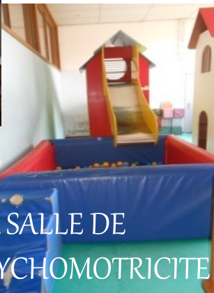
LA SALLE DE PSYCHOMOTRICITE