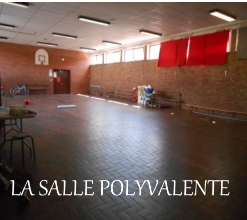
LA SALLE POLYVALENTE