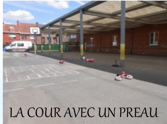
LA COUR AVEC UN PREAU